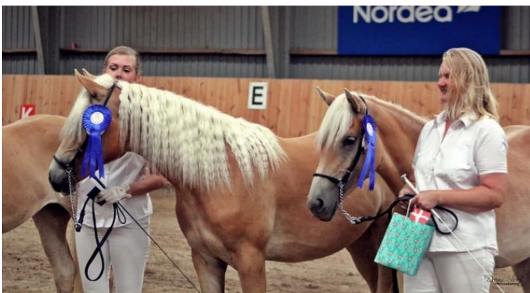
Brayony og Minea