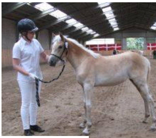
Mulan af Fredensberg