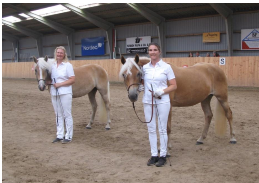
Chrispy og Highnoon